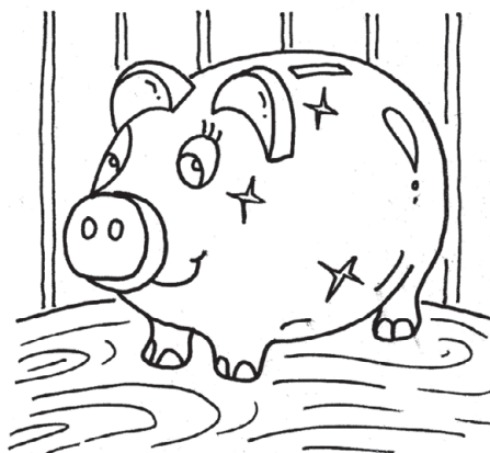
La alcancía de la familia estaba perdiendo peso misteriosamente.